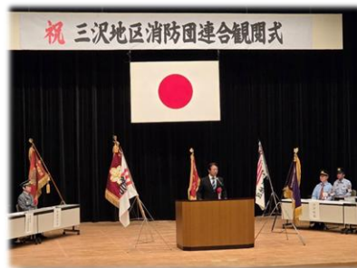
R7.6.22 三沢市 三沢地区消防団連合観閲式