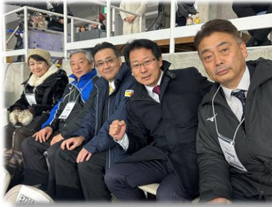
R6.12.15 八戸市 全日本スピードスケート選手権