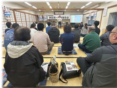
R7.5.25 田子町 国政報告会