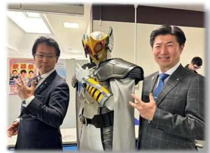
R6.11.3 六戸町メイプルタウンフェスタ