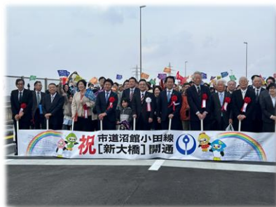
R7.3.22 八戸市 市道沼館小田線「新大橋」開通式