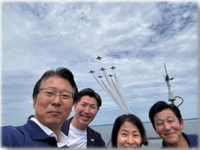
R7.7.26 東北町湖水まつり