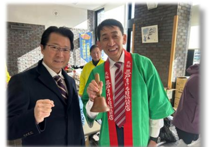
R7.2.9 三戸名物元祖まける日