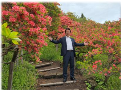
R7.5.10 七戸町 天王つつじまつり