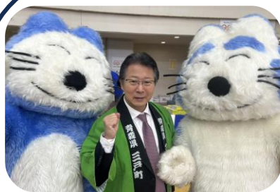
R7.11.29さんのへ感謝祭にて

また、高市政権では国会対策委員会の副委員長として、厳しい国会運営を裏方として支える重要な役割を担うことになりました。