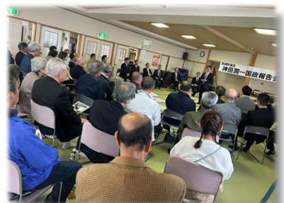
R7.4.20 階上町 国政報告会