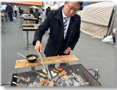
R7.10.25 五戸三大肉フェスタ