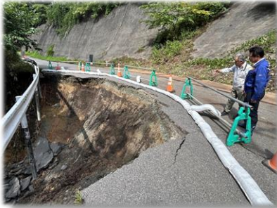
R7.8.24 新郷村 大雨による土砂災害視察